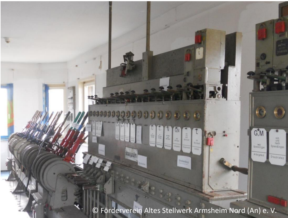
© Förderverein Altes Stellwerk Armsheim Nord (An) e. V.