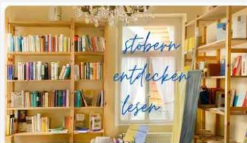
Altstadtverein Alzey e.V.

Sanierung Bücherhaus in Alzey - Feuchtigkeit? Nein, danke!