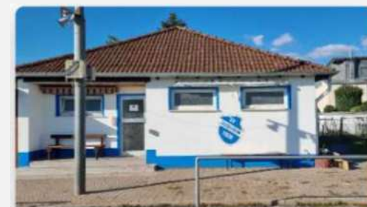
SV 1920 Leiselheim