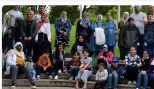
Caritasverband Worms e. V.

Ankommen im neuen Zuhause- Integrationshilfe für Flüchtlinge