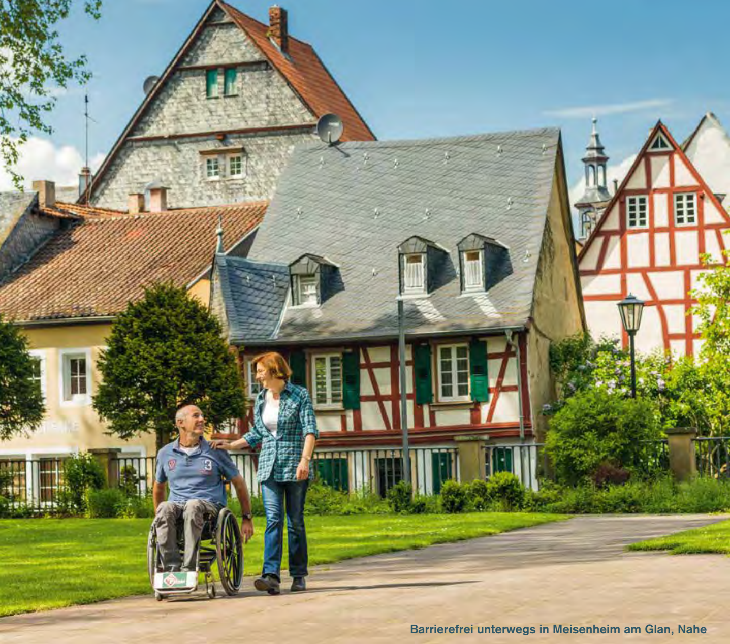
Barrierefrei unterwegs in Meisenheim am Glan, Nahe