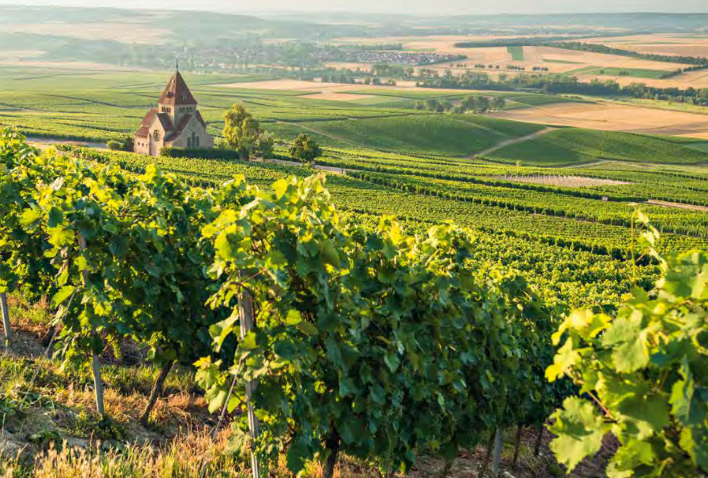
Blick vom Wißberg, Gau-Bickelheim