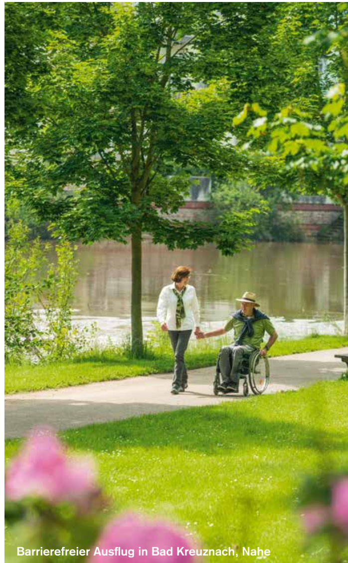
Barrierefreier Ausflug in Bad Kreuznach, Nahe