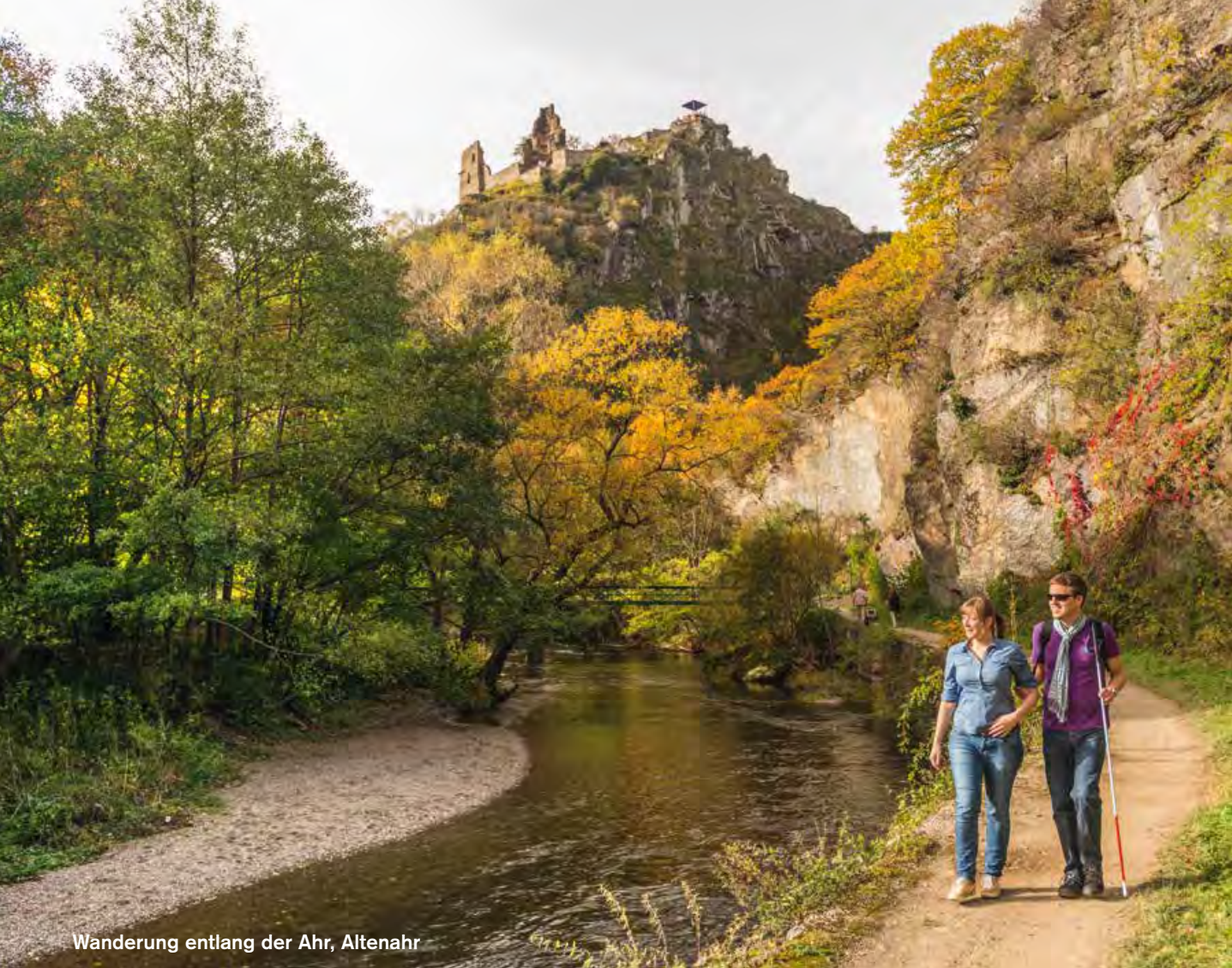
Wanderung entlang der Ahr, Altenahr