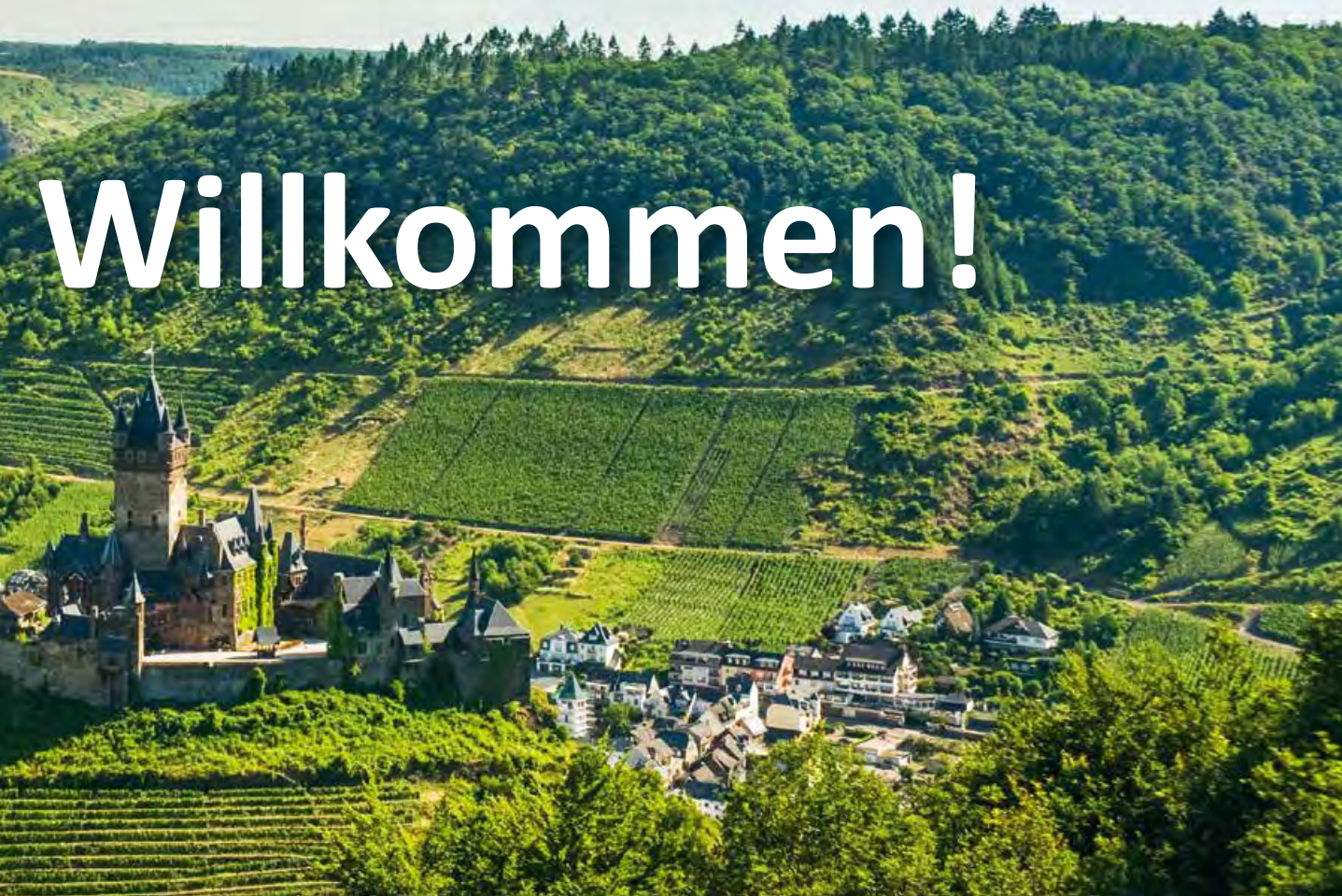
Reichsburg Cochem, Mosel-Saar

Gesundheitsbewusste Gäste und diese, die ihr Wohlbefinden stärken möchten, finden in den zahlreichen prädikatisierten Heilbädern und Kurorten diverse Therapie- und Wellnessangebote. Sportlich aktiven Gästen bietet sich ein unendliches Netz aus prädikatisierten Wander- und Radwegen an.