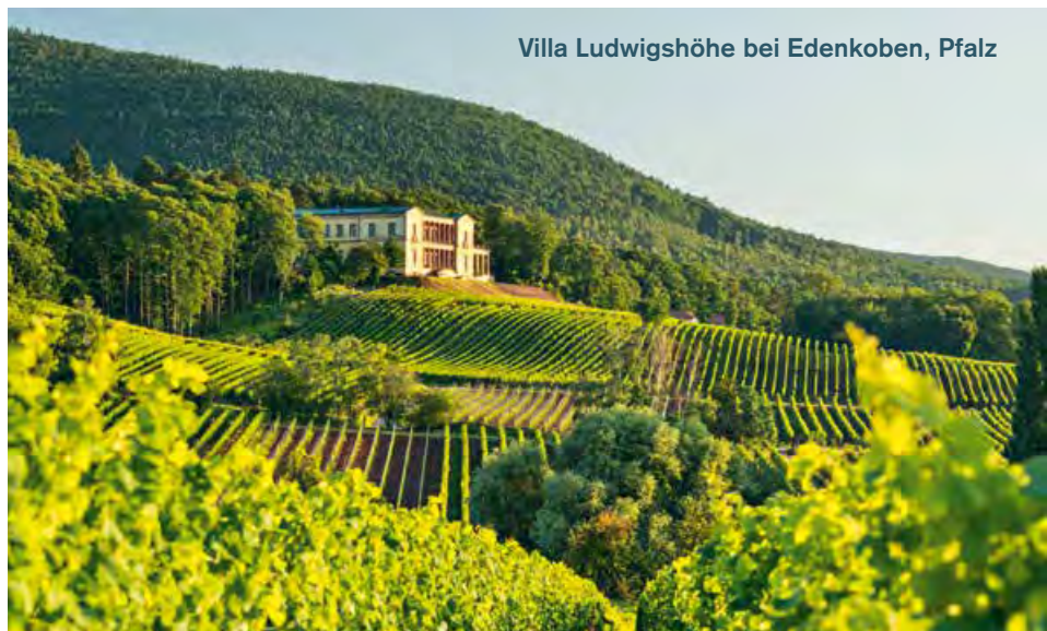
Villa Ludwigshöhe bei Edenkoben, Pfalz