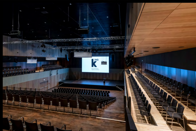
GROSSER SAAL MIT BLICK VON DER EMPORE

Ein flexibles Raumangebot, eine exzellente Akustik und modernste technische Ausstattung - der Große Saal in elegantem Design aus Echtholz ist das Herzstück der KING. Bis zu 1.000 Personen finden auf einer Fläche von 545 m 2 Platz.