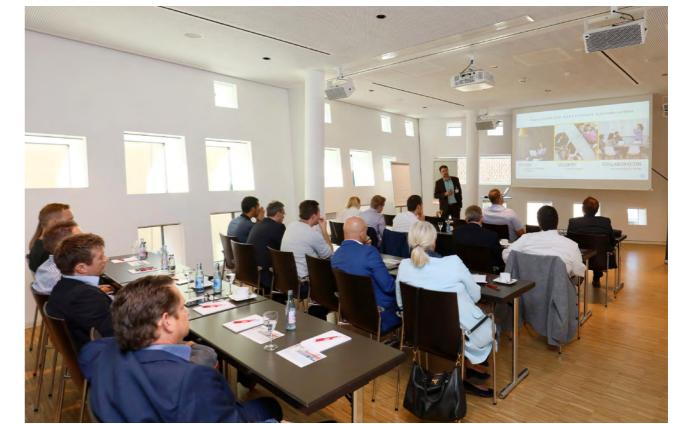
SEMINARRAUM | EBENE 1

Bei Bedarf stehen Ihnen die Foyerflächen als zusätzlicher Raum für Präsentationen zur Verfügung.