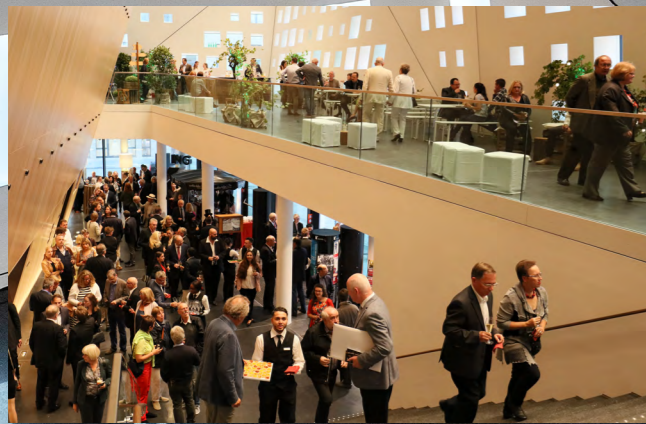
FOYERFLÄCHEN | EBENE 0 UND EBENE 1