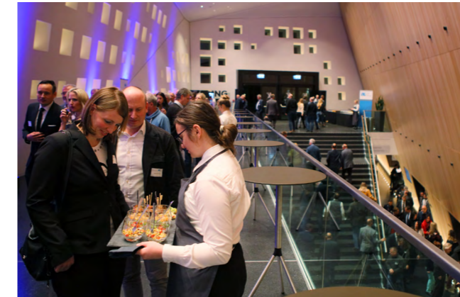
FOYERFLÄCHE | EBENE 1