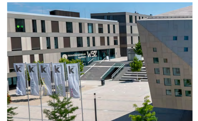
VORPLATZ MIT WBZ

Zusätzliche Räumlichkeiten bietet das WBZ – Weiterbildungszentrum Ingelheim direkt gegenüber der KING. Beide Gebäude teilen sich nicht nur den Vorplatz, sondern sind auch durch einen unterirdischen Gang miteinander verbunden, so dass vorhandene Synergien bei Bedarf optimal genutzt werden können.