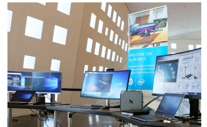
FOYERFLÄCHE | EBENE 1